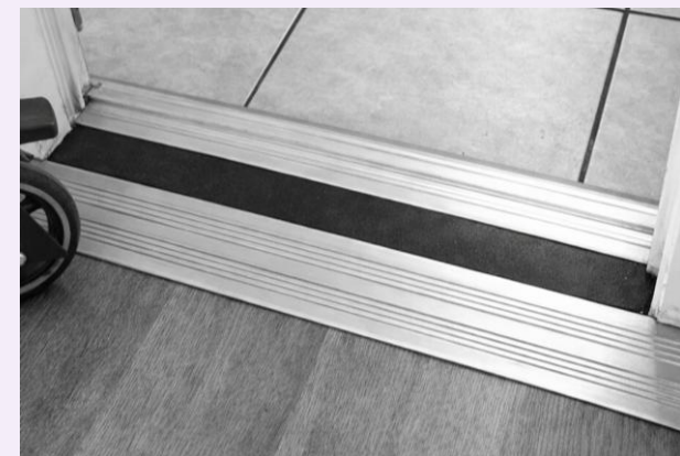
Drempelvervangers: voor een veilige en vrije doorloop in huis