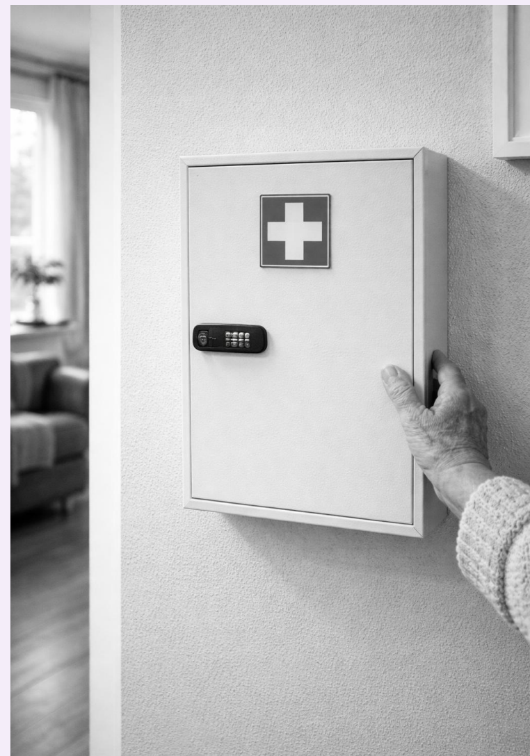
Een medicijnkluis als aanleiding voor bredere signalering

Dit voorbeeld laat zien dat preventieve uitvoering niet alleen bestaat uit technische ingrepen, maar ook uit tijdige signalering en zorgvuldige afstemming binnen het netwerk rond een bewoner.