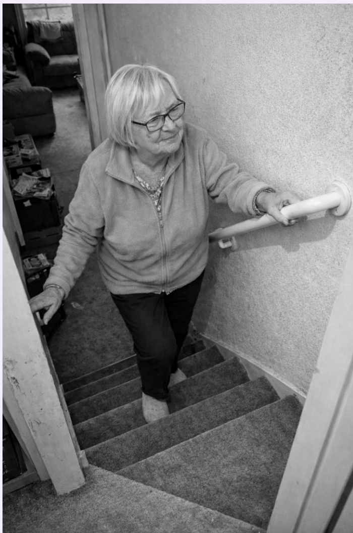
Meer vertrouwen bij elke stap