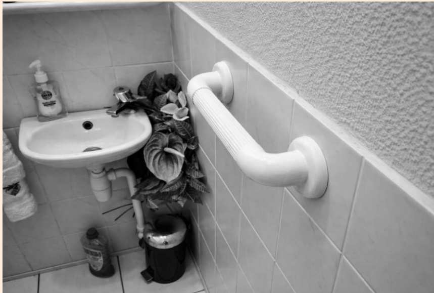
Het plaatsen van steunbeugels: een van de meest uitgevoerde aanpassingen tijdens de pilot in Buitenveldert

In 2025 startte in Stadsdeel Zuid, Woonzorg Nederland, de BelKlus, Stichting SINA en het stadsdeel, een pilot in een wooncomplex met veel zelfstandig wonende ouderen. In situaties als deze komen technische veiligheidsrisico's en sociale kwetsbaarheid samen. De pilot richt zich op het gelijktijdig organiseren van sociale signalering en technische uitvoering.