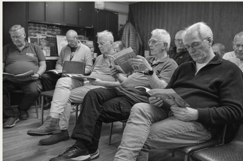
Vakkennis up-to-date houden: vrijwilligers tijdens één van de jaarlijkse trainingen

Gevolg: voorspelbaarheid voor bewoners en partners, ook bij toenemende volumes.